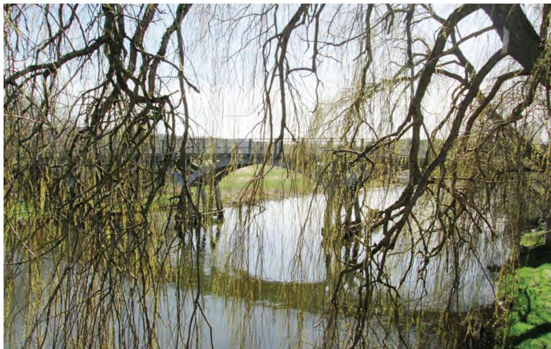
Amtmand Hoppes bro

Hovedoversigten til budgettet har til formål på den ene side at give politikerne et summarisk overblik over den aktivitetsmæssige og finansielle udvikling i de kommende år samt medvirke til løsningen af oplysningsopgaven over for borgerne, og på den anden side at give staten mulighed for umiddelbart efter vedtagelsen at få et summarisk overblik over de kommunale budgetter.