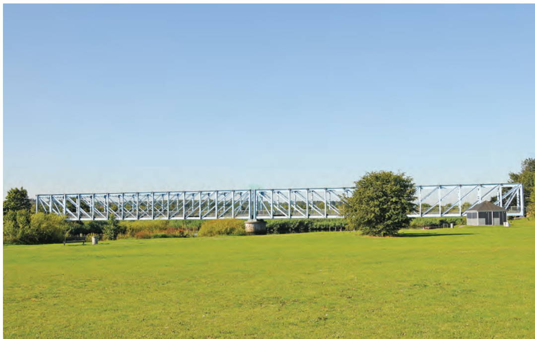
Den Blå Bro

I den flerårige investeringsoversigt er opført rådighedsbeløb for de kommende års anlægsarbejder.