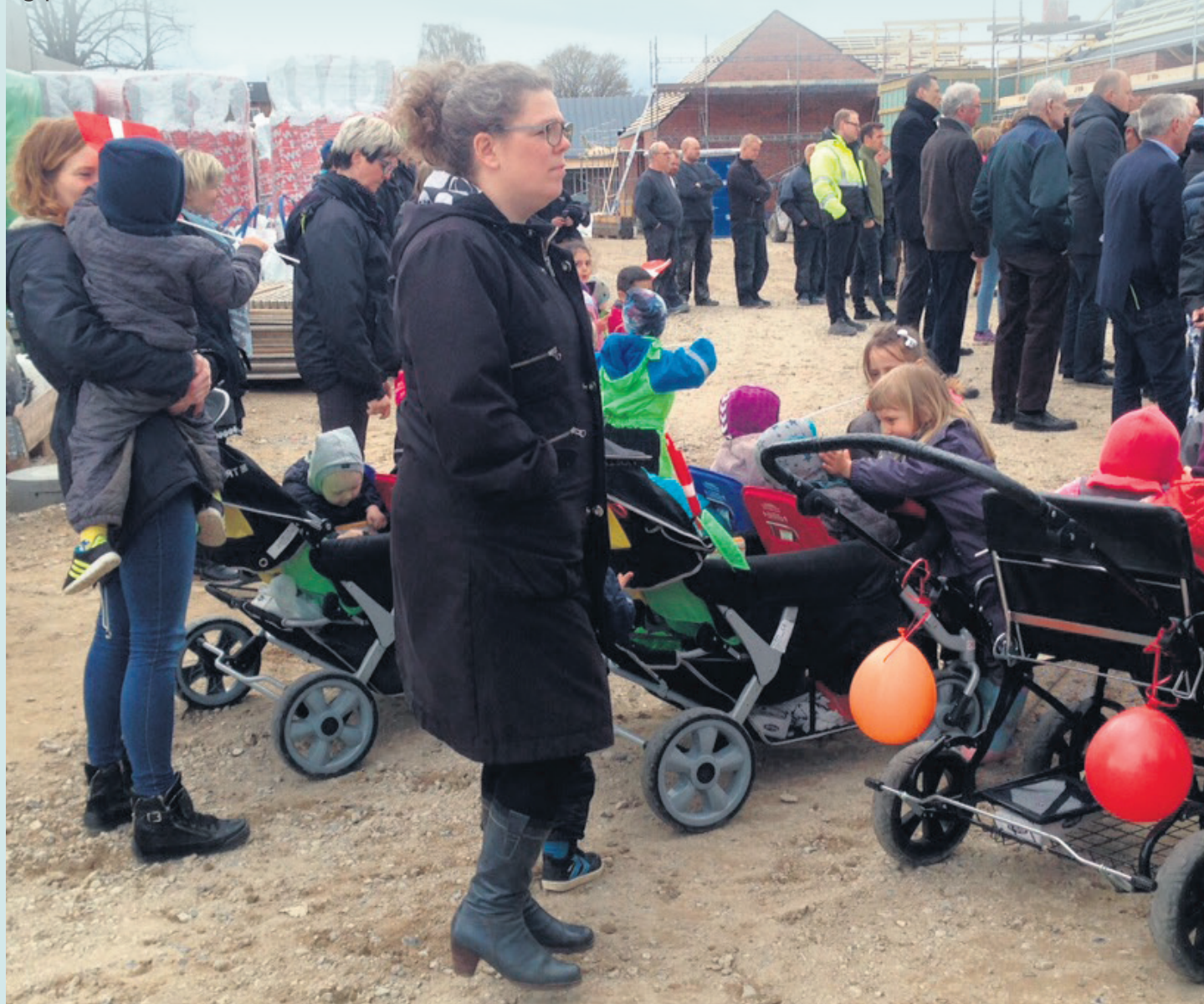
Rejsegildet på Huset Nyvang var en festdag for håndværkerne. Med til gildet var også byrådspolitikere, ældreråd, kommende plejehjemsboere, børn fra børnehuset og involverede samarbejdspartnere.

Torsdag den 27. april blev der holdt rejsegilde på Huset Nyvang. Huset Nyvang, der efter planen vil stå færdigt ved udgangen af november i år, kommer til at indeholde både et plejehjem og en daginstitution. Plejehjemmet består af fire boenheder og en hovedbygning, der samlet kommer til at rumme 60 almene plejeboliger med tilhørende servicearealer. Daginstitutionen får både vuggestue og børnehavegrupper og er integreret i hovedbygningen, blandt andet med fælles køkken- og personalefaciliteter.