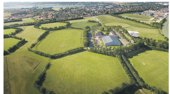
Oversigtsbillede over området ved Dronningborghallen.

Du kan læse mere og give dit besyv med på www.randers.dk/dronningborgbyggeprojekt