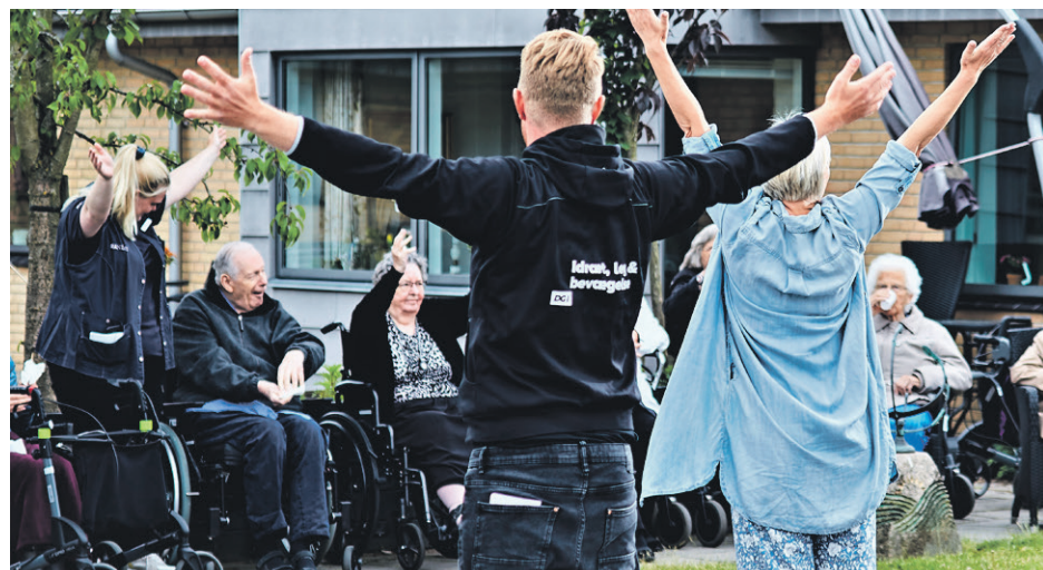
Beboere i bevægelse på Solbakken - det første DGI-certificerede plejehjem i Danmark.

Recertificeringen evaluerer på Solbakken's udvikling. Derfra fastlægger DGI Østjylland et videre forløb for plejecentret.