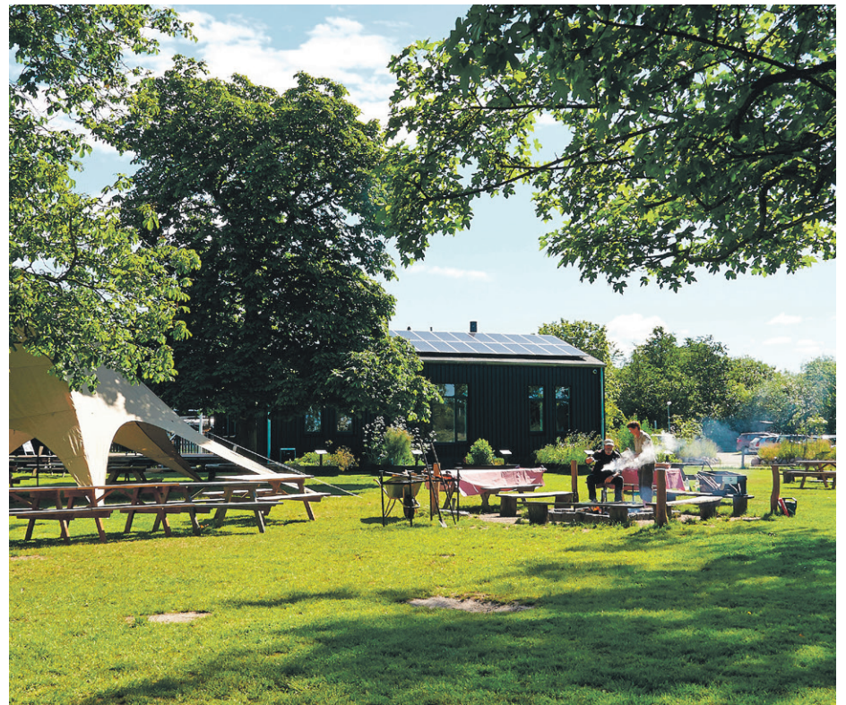
Arrangementerne er gratis og foregår i Randers Naturcenter.