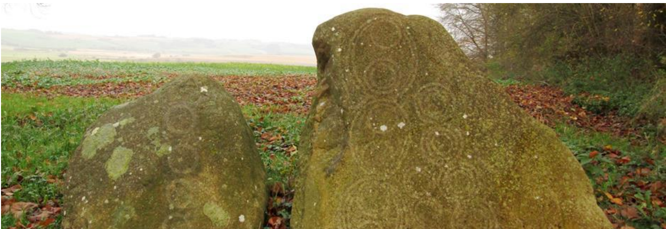
Ved Vandmøllevej i udkanten af Øster Velling Skov står to granitsten med indhuggede cirkelmønstre fra bronzealderen. I dagslys er det så godt som umuligt at se helleristningerne. Der er derfor brugt billedmanipulation for at illustrere, hvordan stenene oprindeligt har taget sig ud.

Her kan man se de indhuggede geometriske cirkelmønstre fra bronzealderen. En fredningssten i granit markerer stedet. De to såkaldte helleristningssten står nær deres oprindelige plads.