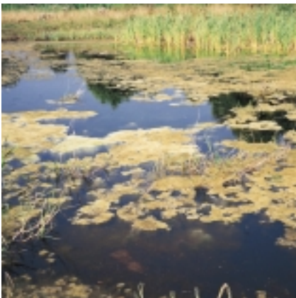
For mange næringsstoffer

Vær opmærksom på, at udsætning og fodring i vandhuller ofte kræver en særlig tilladelse.