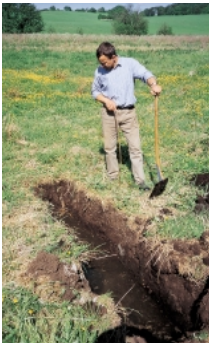
Gravning af prøvehul

Om der er plads til et lille eller stort vandhul er af mindre betydning. Dog er et lille vandhul mere følsomt over for tilgroning og påvirkninger udefra end et stort.