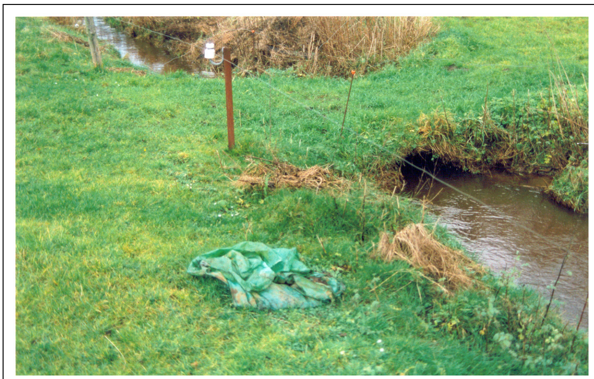
Figur 16. En velanlagt passage over et vandløb, bemærk den høje vandstand i røret som sikre en tilfredsstillende passage af smådyr og fisk.

Afhængig af vandløbets størrelse er den mest hensigtsmæssige udførelse af et vadested en bro eller et nedgravet cementrør. Vær opmærksom på, at få gravet cementrøret godt ned i vandløbsbunden en tommelfingerregel er, at 1/3 af rørets diameter skal være nedgravet. På denne måde virker røret ikke som nogen spærring for op- og nedstrøms passagen af smådyr og fisk. Røret skal endvidere være så stort, at det kan føre vandløbets maksimalvandføring.