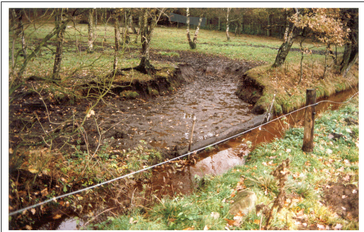
Figur 8. Viser et tilfælde hvor højdeforskellen mellem markens niveau og vandoverfladen i bækken, har været for stor. Dette har medført en stor erosion trods den faste forkant.

Hvis området ned imod vandløbet hælder for meget, eller hvis højdeforskellen mellem marken og vandoverfladen er for stor, vil en fast forkant på vandingstedet ikke hjælpe meget. Store mængder materiale vil til trods for den faste forkant alligevel blive transporteret ud i vandløbet, se figur 8.