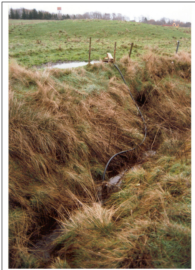
Figur 10. Viser en mulepumpe, der henter vandet op på et sted hvor niveauforskellen mellem marken og vandoverfladen i vandløbet er på min. 2 meter.

Det vil være en god ide, at fastgøre indsugningsslangen til en synlig, solid pæl i vandløbet, på denne måde sikres indsugningsåbningen imod tilstoppelse, og ved vedligeholdelsesarbejder bliver man opmærksom på hvor slangen ligger. Den vinddrevne vandpumpe er sammen med et vandreservoir (badekar eller lign.) også en hensigtsmæssig måde, at bringe vand op til dyrene. Dog må vindmøllen ikke anbringes som vist på figur 11, idet den herved kan være i vejen ved vedligeholdelsesarbejder. Vindmøllen skal være anbragt fri af vandløbet.