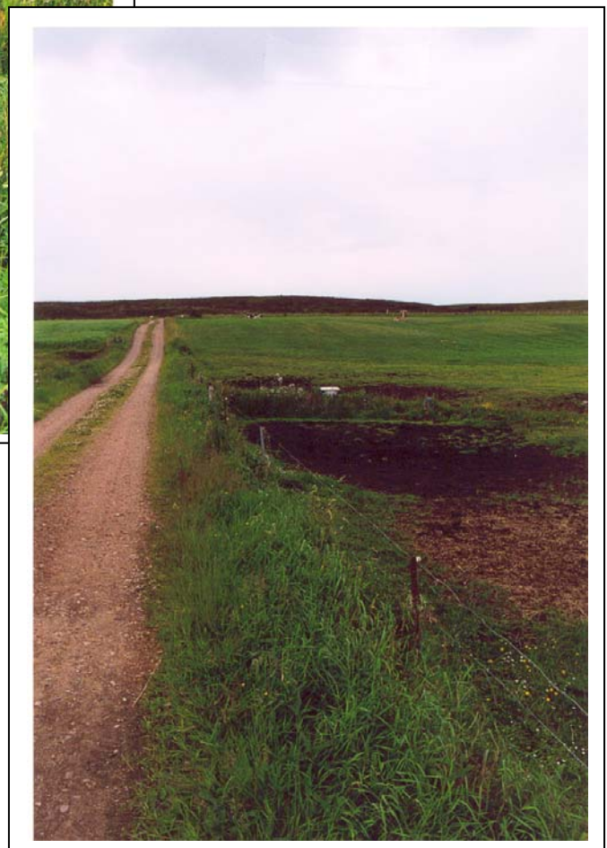
Figur 15. Samme vandløbslokalitet som i figur 14. Efter etablering af afhegning har vandløbet retableret sig ganske smukt, nærbillede af lokaliteten ses i fig.15a.