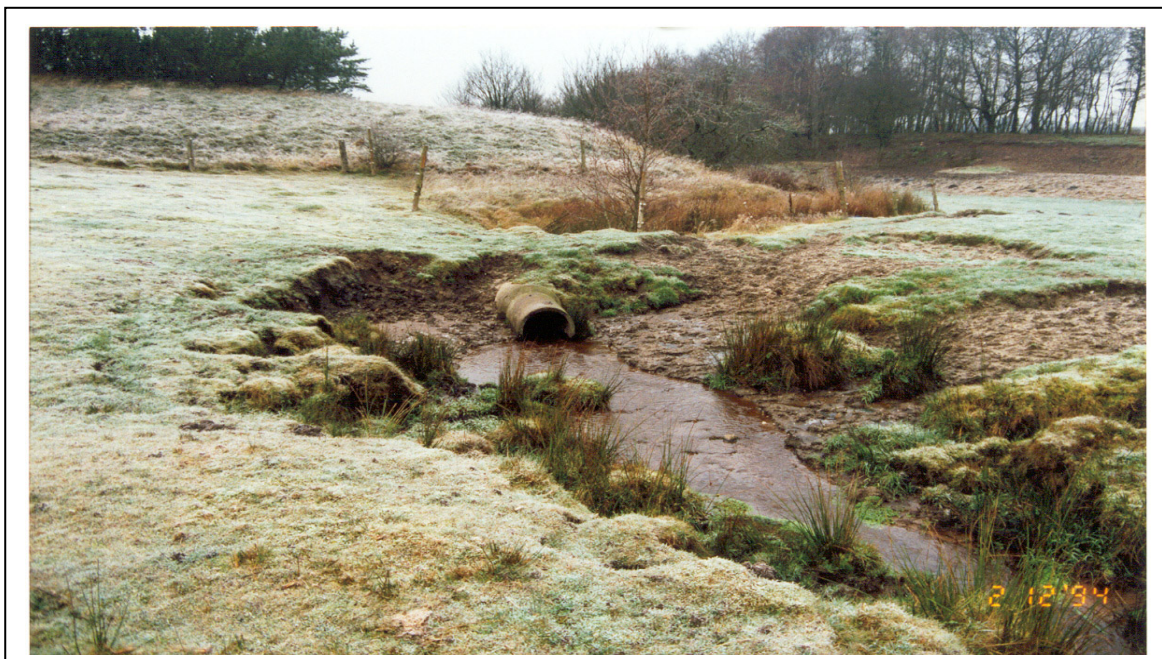
Figur 9. Her har erosion som følge af kreaturerne færd medført et bredt vandløb med lavere vandstand i forhold til røret, på denne måde er der her blevet skabt en selektiv spærring.

Det mest hensigtsmæssigt indrettede vandingssted får man ved at anvende en mulepumpe, en vinddreven vandpumpe eller lign.