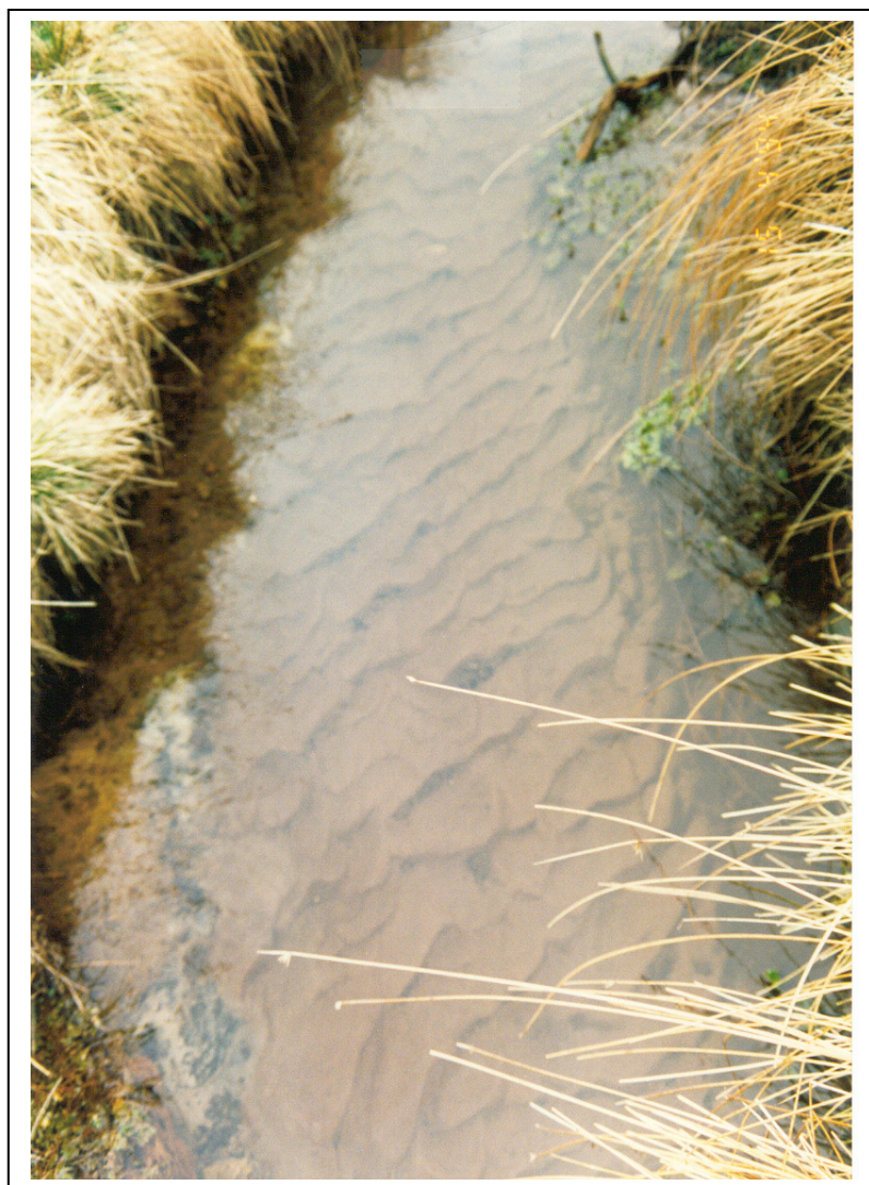
Figur 4. Viser en vandløbsbund bestående af ustabil sand, som er et meget dårligt levested for fisk og smådyr.

For at sikre ørredernes gydepladser samt mange af smådyrenes levesteder i vandløbene, er det af stor vigtighed at hindre sandvandringen i vandløbene. Derfor bør erosionen i og langs vandløbet stoppes/nedbringes. En måde at bidrage til en nedsat sandmængde i vandløbene er at sikre, at vade- /vandingstederne er hensigtsmæssigt etableret.