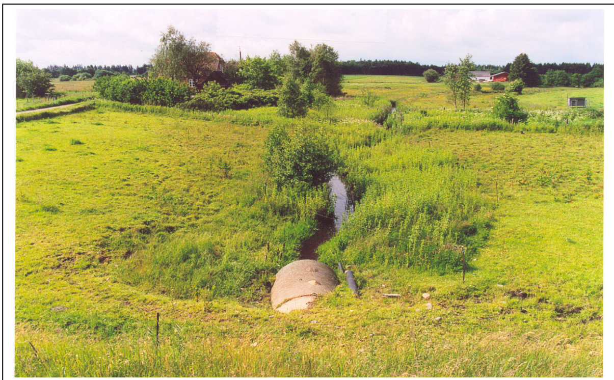
Figur 3. Samme vandløbsstrækning som i fig. 1 og 2 efter 8 års hegning.