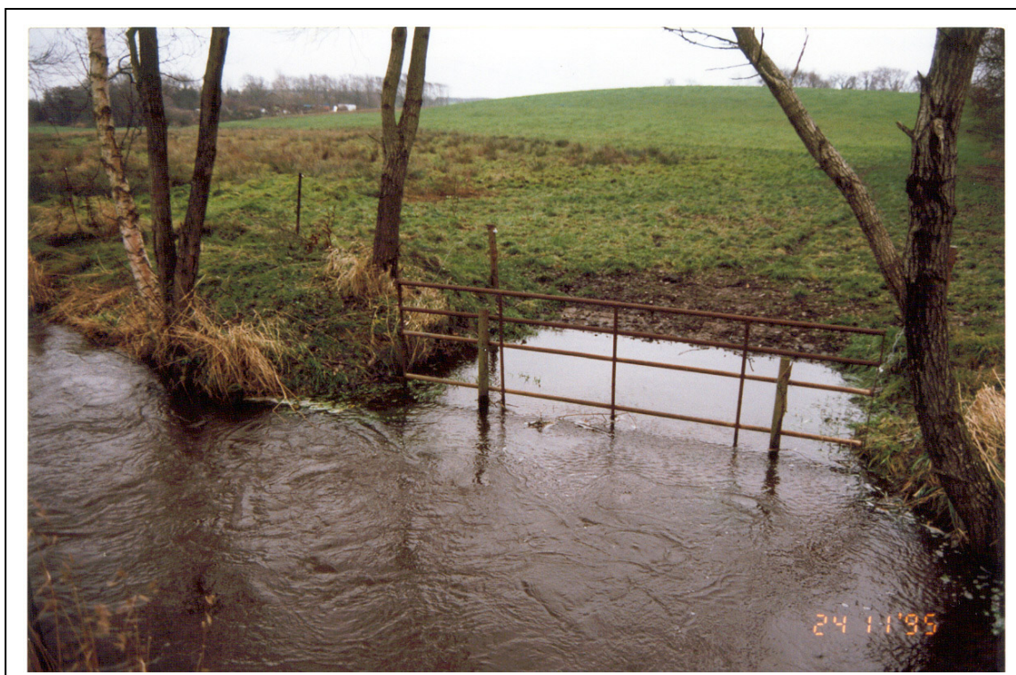
Figur 13. Et vandingssted efter vandløbslovens bogstav.

Efter vandløbslovens § 29 har vandløbsmyndigheden hjemmel til, at påbyde bredejerne at “anbringe og vedligeholde forsvarligt hegn, og at vandingssteder skal graves uden for vandløbets profil og frahegnes dette ”. Figur 13 er et sådan eksempel på et vandingssted, der overholder vandløbslovens bogstav. Det bør her tilføjes, at så længe terrænet bagved ikke hælder for meget, er denne løsning acceptabel. Hvis terrænet havde hældt noget mere ned imod vandløbet, ville vi her have set en tilsvarende borterosion af brinkmateriale p.g.a. den manglende faste forkant og grusstabilisering.