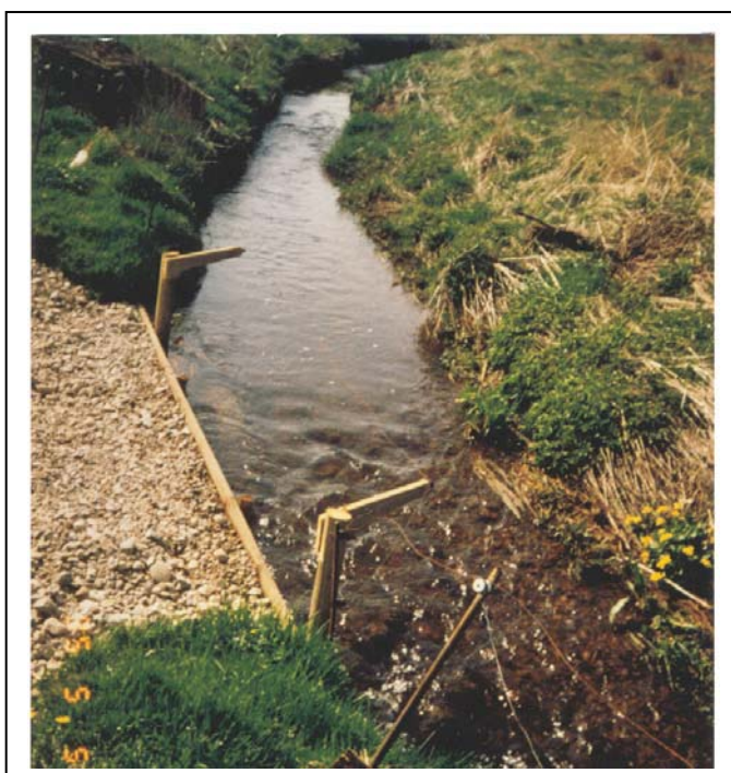
Figur 7. Som i fig.6.