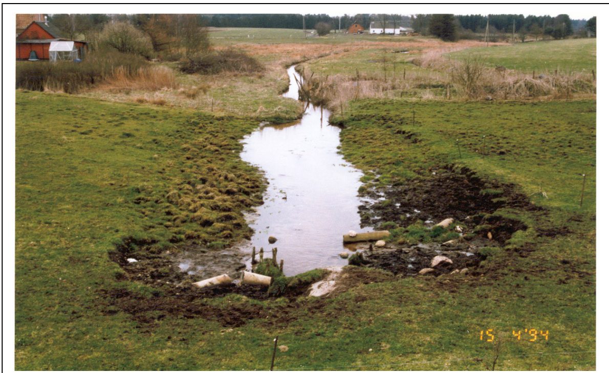
Figur 1. Viser en vandløbsstrækning, der er anvendt som vandingssted, bemærk hvor bred vandløbet er blevet, set i forhold til opstrøms.

Et uhensigtsmæssigt vandingssted er et vandingssted, hvor brinkmateriale kan erodere ud i vandløbet. Erosionen af vandløbsbrinken vil nogle steder gøre vandløbet bredere, hvilket vil medføre en lavere vandhastighed med en ændring af bundsubstratet hen imod et finere substrat, som oftest vil bestå af sand og fint organisk materiale.