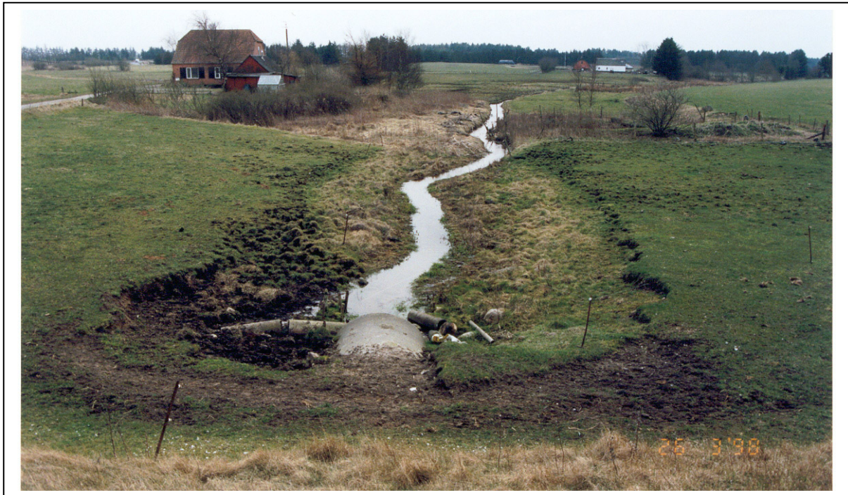
Figur 2. Samme vandløbsstrækning som i fig. 1, 4 år efter at der er foretaget en afhegning, bemærk indsnævringen af vandløbsprofilen.