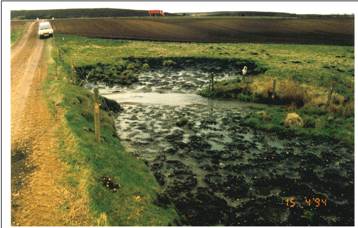
Figur 14. Viser hvor store mængder materiale, der er borteroderet i forbindelse med en kreaturovergang.

Et uheldsmæssigt vadested er en passage over et vandløb, hvor vandløbsbrinkerne ikke er beskyttet imod nedtrædning med deraf følgende borterrosion af brinkmateriale, til skade for vandløbets plante- og dyreliv.