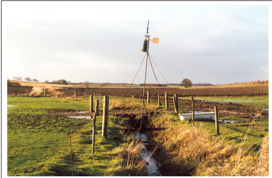
Figur 11. Den vinddrevne vandmølle

Af andre muligheder kan nævnes nedgravning af en cement brøndring inde på marken, og forbinde den med et rør der når ud til vandløbet.