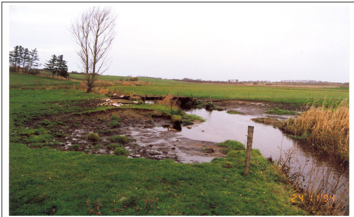
Figur 5. To uhensigtsmæssige vandingsteder overfor hinanden i et mellemstort vandløb, bemærk de mange kubikmeter bortroderet jord, "timeglasformet" vandingsted.

De til tider store blotlagte flader ved vade-/vandingsteder er steder, hvor vandløbet eroderer store mængder sand og jord bort. Dette skaber et forøget behov for oprensning af vandløbet og deraf følgende større udgifter for vandløbsmyndigheden. Endvidere er disse ofte fugtige flader yderste favorable levesteder for nogle små insekter kaldet mitter, som er bittesmå myg, som stikker både dyr og mennesker.