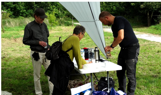
Kaffepause i arbejdet

Vi samarbejder meget ofte med andre foreningen, når vi laver noget på Nordre Fælled. Kontakt os endelig, hvis I er en forening, som gerne vil med ud i naturen.