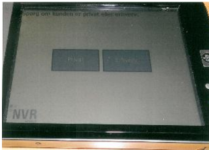
Skærbilleder fra PDA'en med 1. spørgsmål om borgeren kom som erhverv eller privat

Alle biler blev stoppet ved indkørslen på genbrugspladsen. Målingerne blev foretaget af én person.