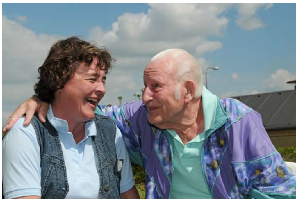
Der er høj tilfredshed med omsorgen for de ældre i Randers Kommune.

Det var en rigtig god, demokratisk proces, hvor vi faktisk er kommet så langt ud til borgerne, som overhovedet muligt, og det har været dej-