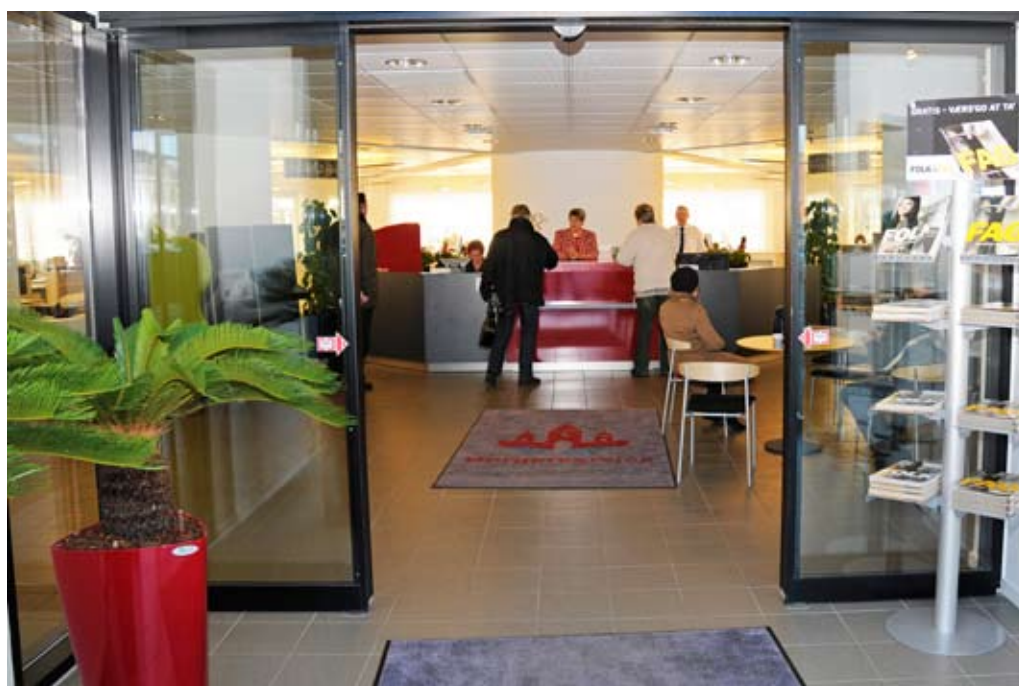
I august 2008 indviede Randers Kommune en ny borgerservice.

2008 var også året, hvor Byrådet besluttede at lade det tidligere rådhus i Langå blive på kommunale hænder. I samarbejde med de gode kræfter i Lokal-Samfundet i Langå er der derfor lavet et stort forarbejde for at afklare økono-