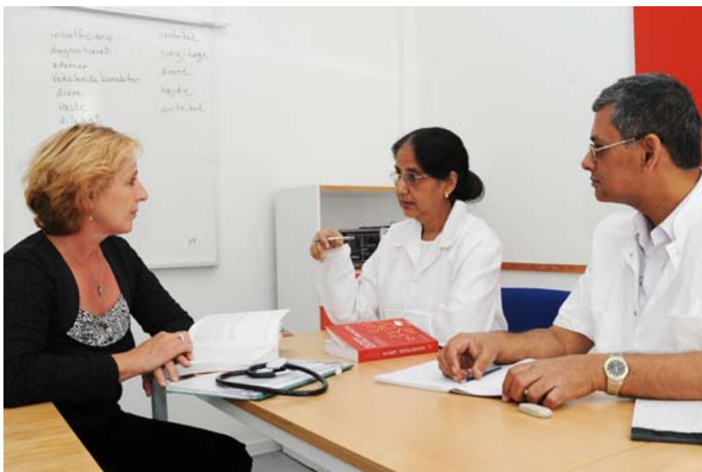
Udlændinge skal sikres let adgang til integration til arbejdsmarkedet.

Der er tale om et samarbejdsprojekt mellem flere parter, hvilket giver mig anledning til at fremhæve, at vi i Randers har tradition for et godt samarbejde med arbejdsmarkedets parter, hvilket er uhyre vigtigt, når vi skal nå de mål, vi har sat os.