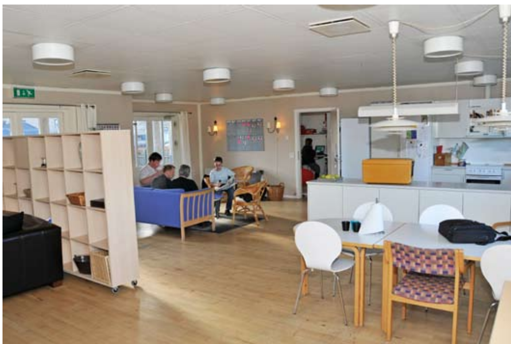
Det nuværende Tronholmcenteret skal efter planerne i fremtiden rumme Forsorgshjemmet Hjørnестenen.

I 2008 har vi arbejdet med at skabe en rusmiddelpolitik, der tager udgangspunkt både i Vision 2016 og i ønsket om at sætte forebyggende ind over for rusmidler. Vision 2016 er meget ambitiøs på området og foreslår således, at vi skal halvere antallet af misbrugere i forhold til 2007. Og det er helt nødvendigt, at vi