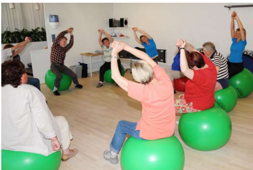
I sundhedscentret er der mulighed for både træning og genoptræning.

Sundhed og ældre står også for et andet byggeri på Thors Bakke, nemlig etableringen af det nye, Randers Sundhedscenter, som vi bygger, men som får sundhedstilbud fra både offentlige og private, idet både Region Midtjylland og private bliver aktører i centrets 6000 kvadratmeter. Centret skal være færdigt i 2011.