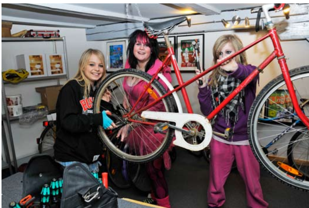
Kaosambassaden er et alternativt tilbud til unge i midtbyen i Randers Kommune.

For de aller yngste 0 til 6-årige har vi gang i et projekt, som fokuserer på overgange, altså overgang fra f.eks. forældre til vuggestue, vug-