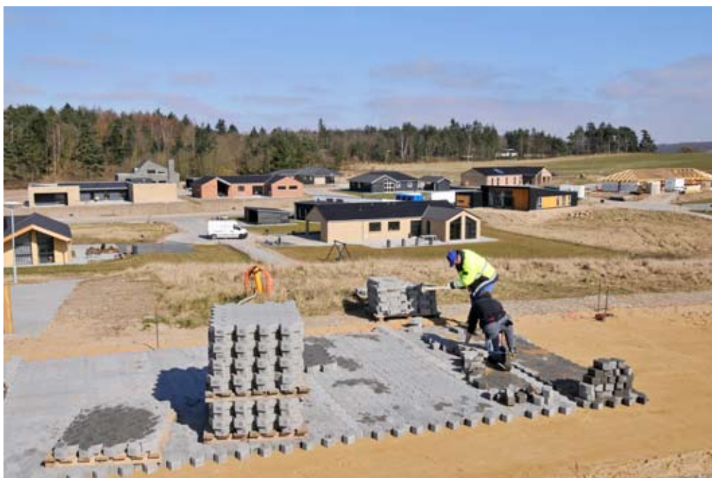
Attraktive byggegrunde til både erhverv og bolig, bl.a. som her i parcelhusudstyknngen Bøgebakken i Stevnstrup.

I Randers by vil særligt en lokalplan fra 2008 sætte væsentlige spor i byen. Det er lokalplan 508 for Thors Bakke. Den tidligere bryggerigrund kommer til at rumme både et nyt sundhedscenter og 40 nye ældreboliger ligesom kommunen også etablerer et stort antal underjordiske parkeringspladser. Udover de kommunale tiltag på grunden er der mulighed for at etablere detailhandel, kulturelle oplevelser og forskellige former for liberalt erhverv. Jeg ønsker også, at der bliver plads til rekreative områder i form af en bypark.