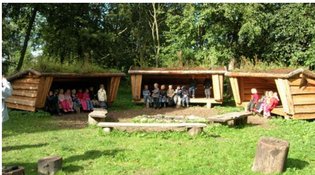
Udebørnehaver og naturskolen giver børnene kendskab til og respekt for naturen.

Tre millioner kroner, der er afsat på budgettet for 2009-2010, skal medvirke til at skabe op-