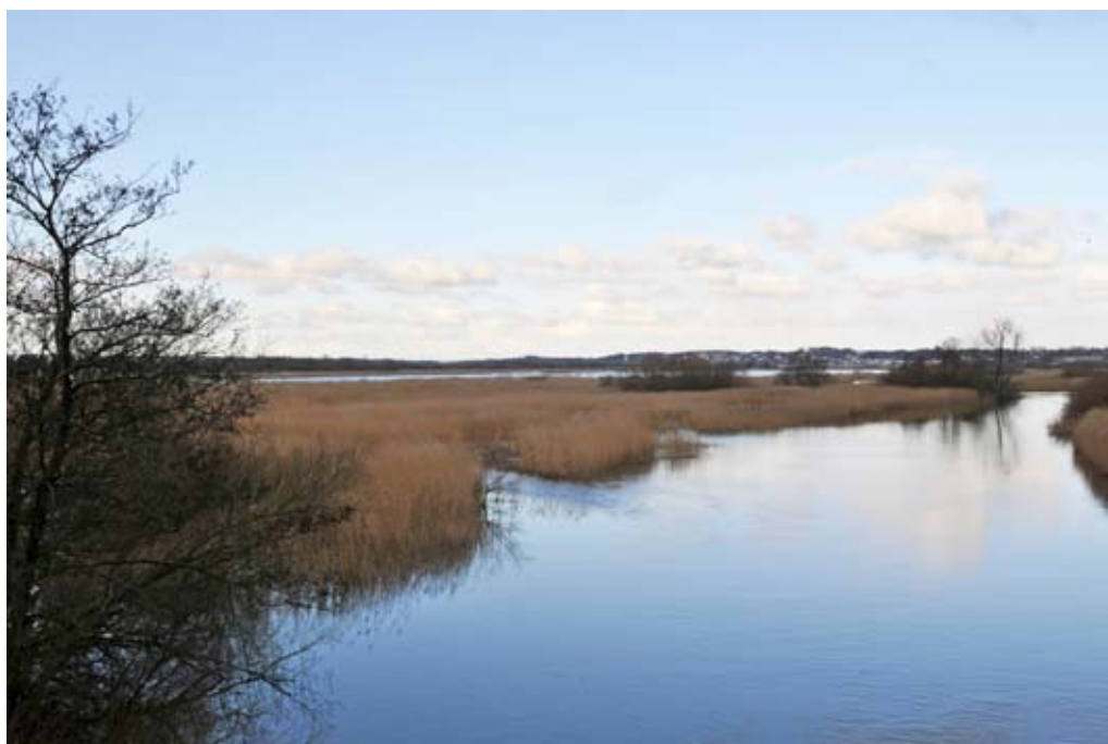
Vorup Enge er en del af et kommende, sammenhængende vådområde fra Randers til Langå.

Samlet set indeholder Randers Kommunes infrastrukturplan projekter, der skal finansieres af Randers Kommune, for mellem 1,3 og 1,85 mia. kr. frem til år 2035. Det svarer til årlige udgifter på mellem 50 og 69 mio. kr., og det er et meget ambitiøst mål. Men planen beskri-