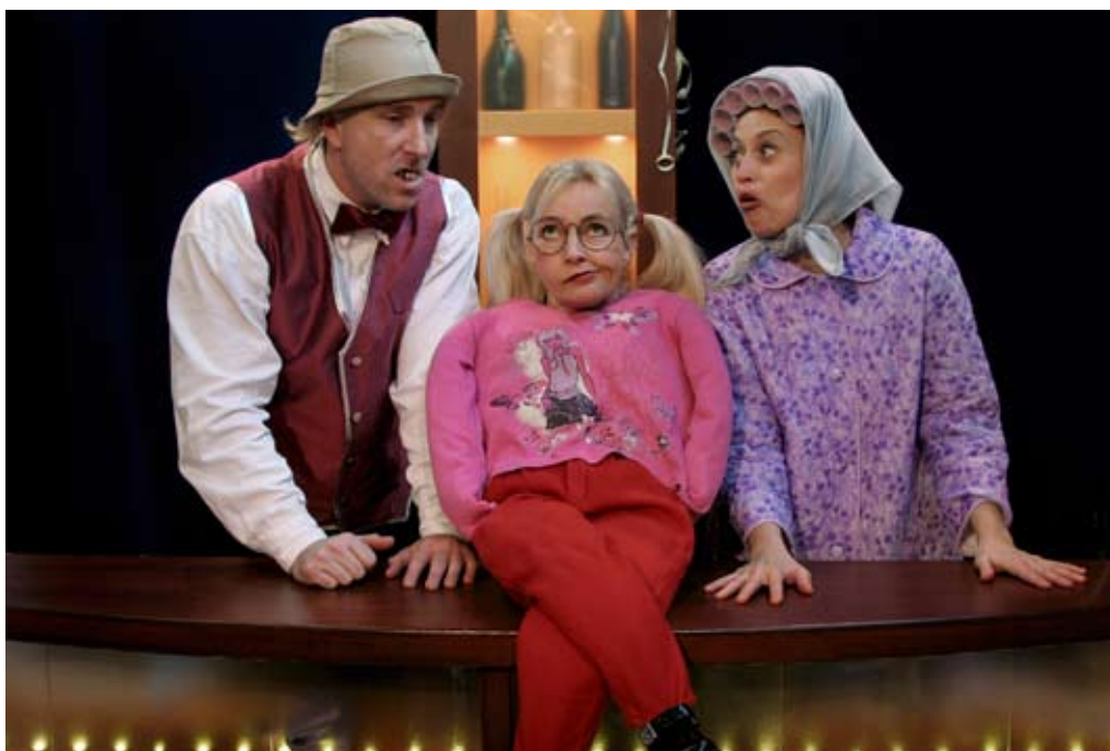
Randers Egnsteater har stor succes med forestillinger i lokale forsamlingshuse.

At Randers er en kommune, der kan løfte store begivenheder på kultur- og fritidsområdet skyldes blandt andet det enorme arbejde, der gøres af de mange tusinde frivillige i idrætsforeninger, kunstforeninger, aftenskoler mv. Det frivillige arbejde udgør en meget stor værdi både for borgerne, som benytter tilbuddene, og for kommunen som helhed.