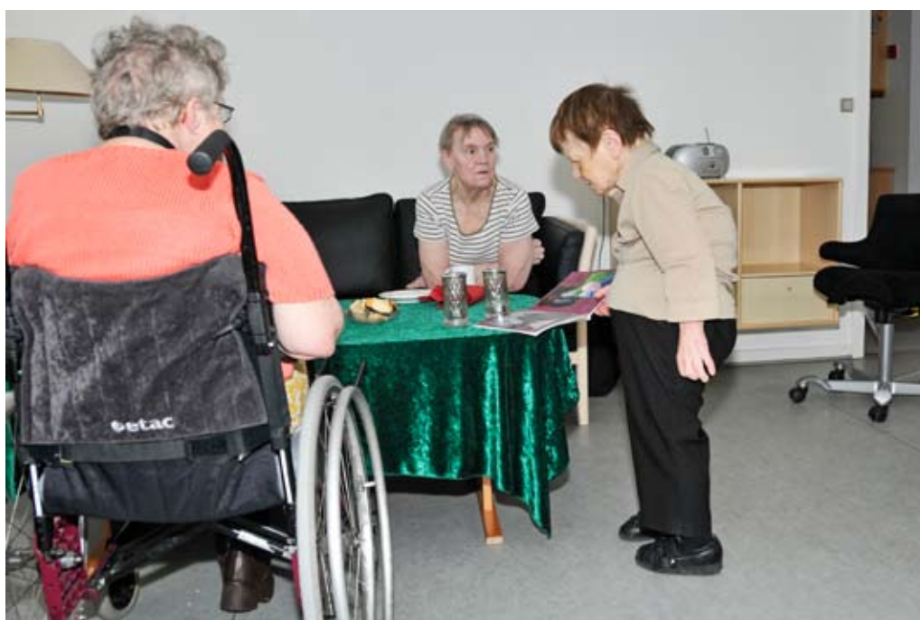
Beboerne i Tronholmcentret kan se frem til nye boliger i Paderup.

Også på handicapområdet har 2008 bragt nye tiltag med sig. Handicapområdet er nu inddelt i fire områder med hver sin områdeleder. I årets løb har alle områdelederne indgået aftaler med Socialudvalget på et fælles grundlag. Det betyder, at vi får et handicapområde, hvor institutionerne i højere grad end tidligere samarbejder og støtter hinanden. Lederne på området har gjort en stor indsats for at udvikle dette fælles grundlag.