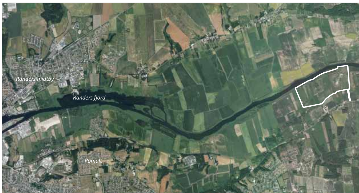
Luftfoto fra 2013 med lokalplanområdets afgrænsning markeret med hvid kontur.